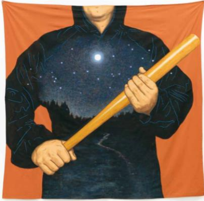
오늘 밤 많은 것이 결정된다, 2017, 천 위에 아크릴릭 과슈, 젯소, 210x210cm

는 그림을 그렸다고 고백한다. 하지만 어느 순간부터 각자 고민을 안고 살고 있을 관객에게 자신의 불만을 토로하는 것이 아니라는 생각을 했다. 작품의 무거움을 버리고자 인물과 사물을 아이콘화하여 가볍게 만화처럼 천 위에 그리기 시작했다. 상세 묘사가 없기에 작품 속에 등장하는 인물은 익명의 대중이 되었다. 이우성은 이번 전시에서 다시 상세 묘사가 있는 인물을 등장시킨다. 이를 통해 구체적 인물이 드러나는 모습을 볼 수 있다. 인물의 구체화를 통해 우리가 사는 삶과 현실을 있는 그대로 포착하고자 했다.