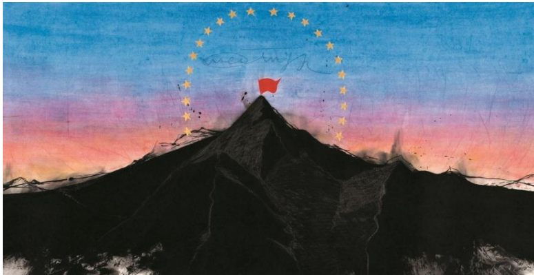
웨이칭지, Occupying Paramount 2, 2012, Ink and mixed media on rice paper, 70x136cm

우리는 웨이칭지의 작업에서 별로 가득 찬 파라마운트 영화사 로고, 스포츠 상표 퓨마 로고, 할리우드 이미지 또는 중국 공산당의 상징인 낫과 쇄망치, 도시의 고층빌딩과 같은 우리가 일상 생활에서 쉽게 만나는 익숙한 요소들을 발견할 수 있다. 또한 동양의 정취를 느낄 수 있으며 중국의 전통문양과 도상들이 어떤 방식으로 현대사회와 융합하는지, 예를 들어 대나무가 새로운 맥락 속에서도 이전과 같이 굳세고 강인하며, 고결한 의미를 지니고 있는지 의문을 가지게 한다. 고대의 인간에게 길잡이 역할을 하던 존재인 복두칠성은 현재에도 유효한가?