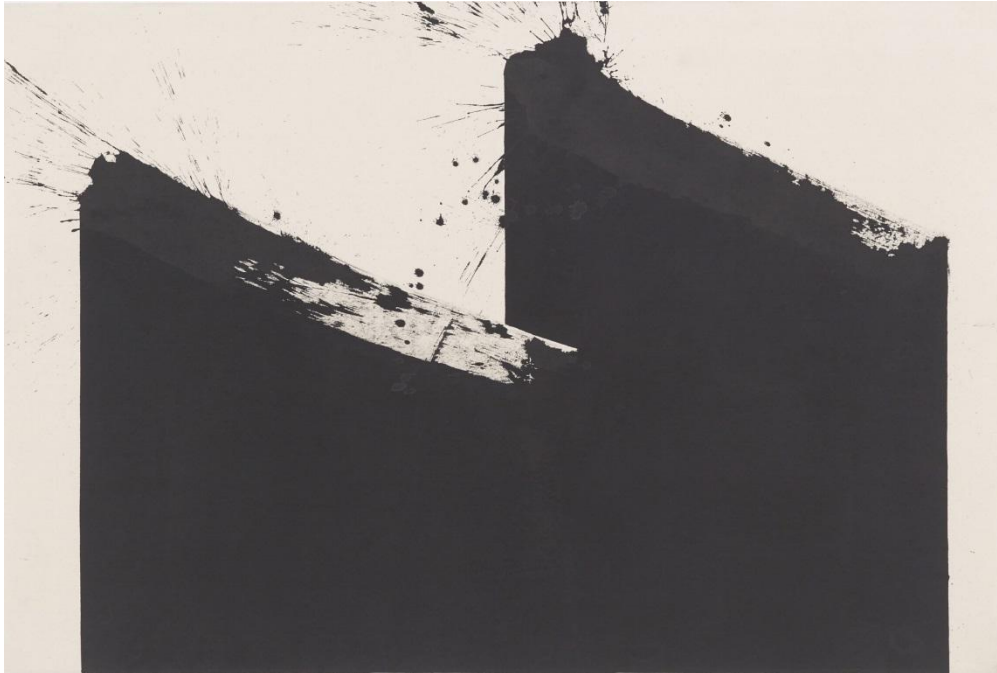
김호득, 겹-사이, 2013, Ink on cotton, 120x180cm

먹의 자취를 힘차게 하얀 여백 위에 올리고 있는 작가 김호득은 1975년 서울대학교 미술대학 회화과를 졸업하여 1985년 동 대학원 동양화과를 졸업했다. 그는 오랜 시간 동안 먹물이 튀고 베인 작업실에서 묵(墨)의 어둠과 깊음을 향해 꾸준히 탐구하며, 먹물과 함께 그의 생애를 보내고 있다. 검은 흑(黑)과 흙 토(土)로 이루어진 상형문자 '묵(墨)', 즉 연소하여 타고 남은 그을음 속에서 작가는 우주, 생명, 기운생동을 발견하며 그의 삶을 기록해왔다.