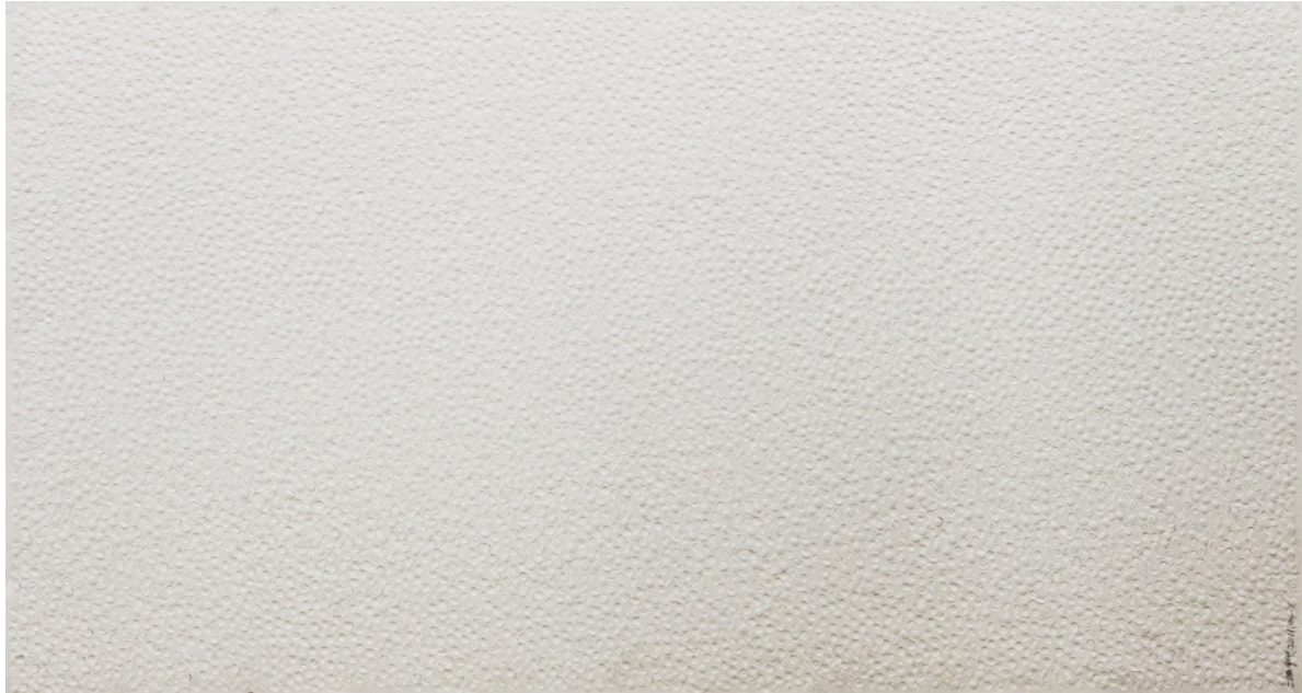
장위, Fingerprints 2011.8-1, 2011, Rice paper, water, nail polish, 100x200cm

1991년부터 시작된 <지인(指印)> 연작은 2001년에 이르러 장위의 새로운 창조적인 작품으로 자리매김하게 되었다. 전통적으로는 승낙과 계약을 상징하며 중국문화에서 개인의 존재와 정체성을 대표하던 '지인'은 급속하게 변화한 현대 중국 사회 속에서 과거의 의미가 퇴색되고, 이전의 중국화의 제작 방식 또한 현대사회에서 갈 곳을 잃게 되었다. 장위는 정신과 육체의 수행의 장으로써 내면 치유의 정수를 찾고자 <지인> 연작을 시작하였다.