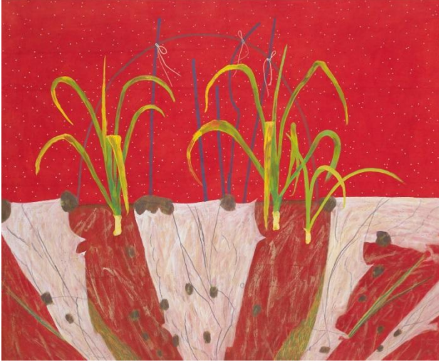
김선두, 별을 보여드립니다-붉은땅, 2015, Color powder on rice paper, 143x173cm

투박하지만 따스하고 포근한 풍경을 수묵채색으로 화폭에 담아내는 작가 김선두는 1982년 중앙대학교 한국화과와 1984년 동 대학원을 졸업하였고 현재 중앙대학교 한국화과 교수로 재직 중이다. 그는 삶의 온기와 소소한 인간사를 서정적으로 그리되, 장지기법, 역원근법, 콜라주 그리고 철묵화까지 작가만의 실험적인 방식으로 동양화를 다채롭게 표현하고 있다. 작가는 고향의 대지를 조형적 기교나 형식이 아닌 진솔한 이야기로 전달하고자 노력한다.