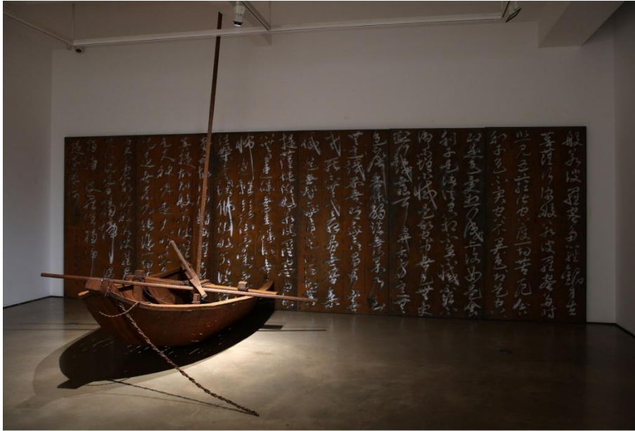
조환, 무제 Untitled, 2015, Steel, polyurethane, 375x732x353cm

조환은 1986년 세종대학교 회화과에서 학부를 마치고 1988년 동 대학원에서 석사 학위를 받았으며, 1992년 뉴욕 오브 비주얼 아트에서 조소를 공부하였다. 뉴욕에서 거주하는 5년 동안 조소에 심혈을 기울인 작가는 동양의 '먹'의 개념을 다시 깨달았을 뿐 아니라, 공간에 대한 인식도 새로워졌다고 한다.