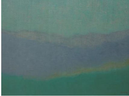
멀리에서 From a Distance