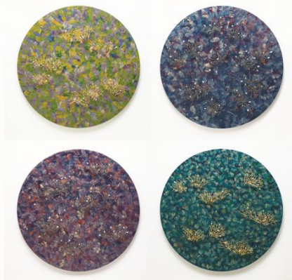
하늘 그리고 비밀정원 Sky and Secret Garden