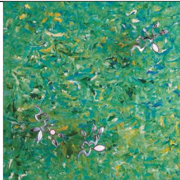
작은 꽃 Little Flower

자연에서 불어오는 바람을 서정적으로 그려낸 작품이다. 채림은 여기서 한국적인 색채를 직선으로 쌓아가며 옷칠로 표현하고 있다. 전체적으로 엷은 녹색을 띤 캔버스에 푸른색, 빨간색, 하얀색, 노란색, 밤색, 주황색, 보라색 등 단청을 연상시키는 색채들이 조화를 이루고 있다. '선'의 반복이 '면'이 된다. 이렇게 완성된 화면에 나뭇가지를 연상케하는 주얼리 조형물을 설치함으로써 회화와 조각이 조합된 작품을 탄생시켰다. 작가는 이 작품을 통해 생동감과 자연의 향기가 가득한 평화로운 화면을 구현하고자 했다.