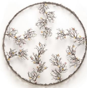
과수원 하늘 Sky in the Orchard