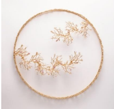
과수원 하늘 Sky in the Orchard