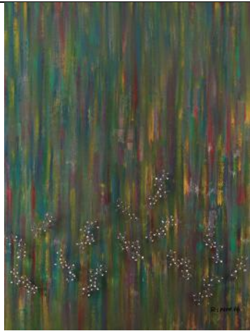
바람의 색, 나무의 색 Colors of the Wind, Colors of the Tree