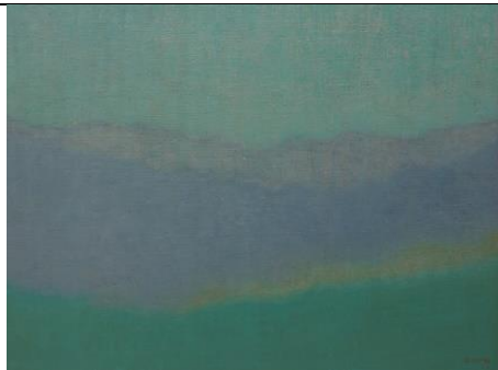
멀리에서 From a Distance